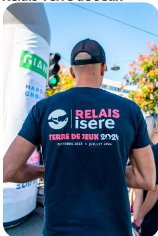
Relais Terre de Jeux